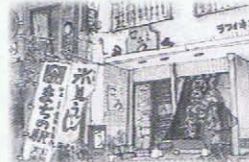
味の笹義 (ます寿司の駅)