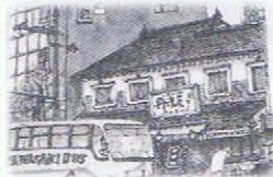
池田屋安兵衛商店 (くすりの駅)