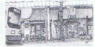
月世界本舗 (和菓子の駅)

いたち川にある、平成の名水100選に選ばれた「富山の名水」や、「ます寿司」「老舗の和菓子店」「富山の菓」など、元気な富山のお店で、初めて知る味を楽しんでいただきます。