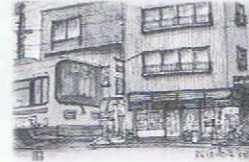
松住商店 (和ろうそくの駅)